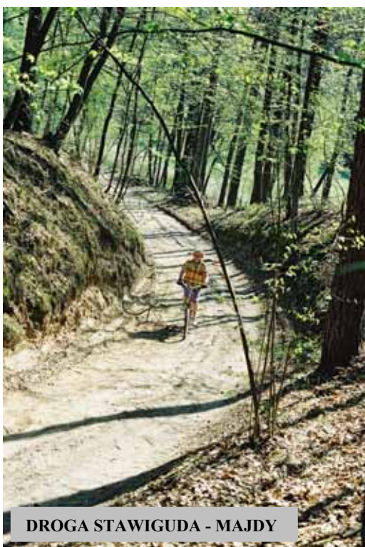
DROGA STAWIGUDA - MAJDY

nieograniczona, dlatego zdarza się jednorazowo, bez specjalnego przemęczenia, pokonywać stosunkowo duże odległości.