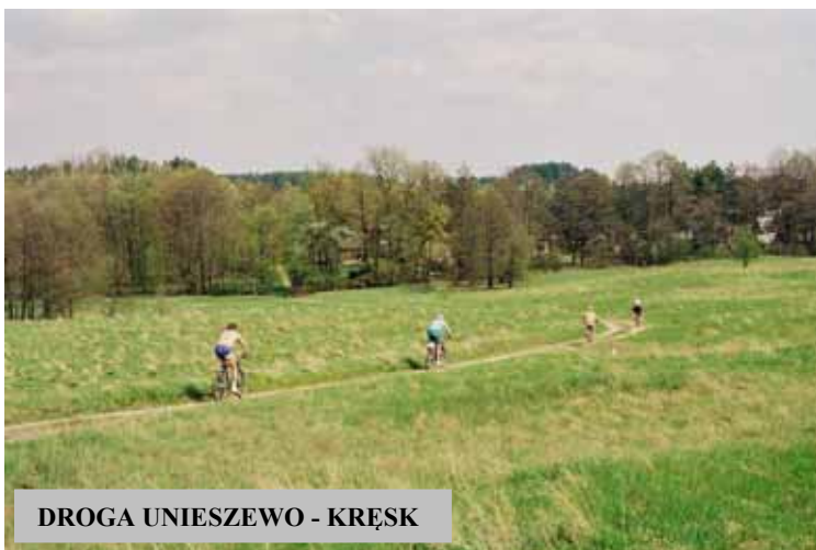
DROGA UNIESZEWO - KRĘSK

W tym rzadko zaludnionym terenie nieodzowne w organizacji wycieczek okazały się mapy w skali 1 : 25 000 i 1 : 50 000 (mapa aktualizowana w 1998 r.), możliwe do uzyskania dopiero od kilku lat ponieważ obejmują niedostępne do niedawna rejony Łańska. Tutaj wędrowni z mapą mają w sobie wiele tajemniczości, podróżny czuje się czasami wręcz odkrywcą. W tak urozmaiconym terenie można wyznaczyć wiele niezależnych okrężnych tras, zawsze (koniecznie!) z inną drogą powrotną w stosunku do wyjazdu. Trasy mają od