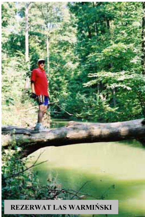
REZERWAT LAS WARMIŃSKI

Zdjęcia są rejestracją amatorską, często bez prawidłowego nasłonecznienia. Cały zbiór nie jest też profesjonalną archiwizacją, nie jest również kompletny. Powstał w sposób naturalny i pierwotnie nie zamierzony jako opracowanie o charakterze dokumentalnym. Specjalne zainteresowanie kapliczkami i przydrożnymi krzyżami w pewnym momencie stało się oczywiste bez żadnych wstępnych planów, w czasie powakacyjnej selekcji urlopowych zdjęć i notatek.