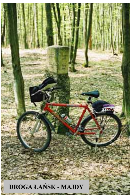
DROGA LAŃSK - MAJDY